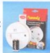
FL 100 22H

Einfache Installation des Gerätes an der Decke